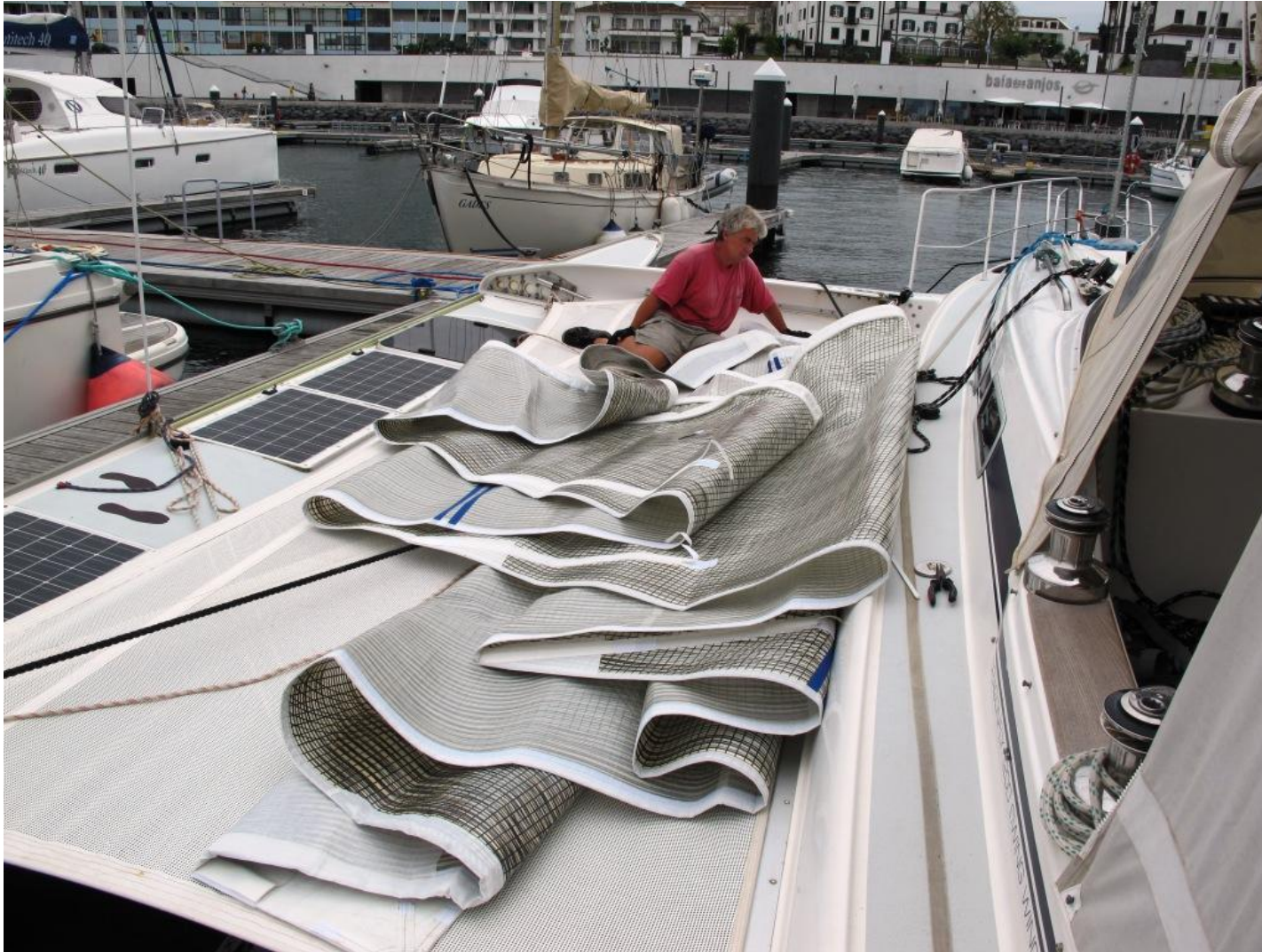
Das Trampolin erweist sich einmal mehr als ideale Arbeitsfläche.