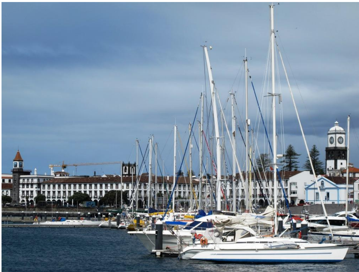
Unser 'Arbeitsplatz' in der Marina von Ponta Delgada auf São Miguel.